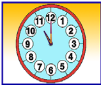
It's eleven o'clock.