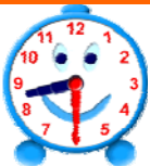
It is half past eight.