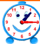
It is a quarter past one.