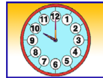
It's ten .